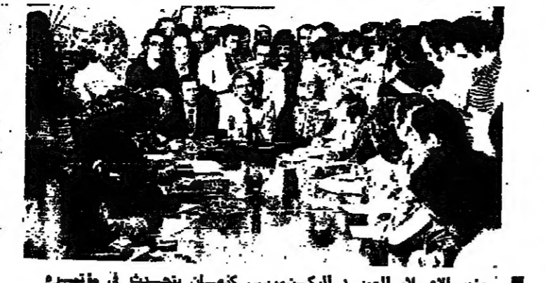
وزير الاعلام العماد موسى خنمان يتحدث في مؤتمره الصحفي امس ، ويحدد المبرم للمسلمة وزارة الاعلام السيد رامز خنمان وحشد من الصحفيين

قال وزير الاعلام والتمهيد العميد الركن موسى خنمان في مؤتمره الصحفي امس : ان حكومتنا حكومة عسكريين لا حكومة عسكرية ، وهننا الاولى اعادة الامن والهدوء والرفاهية ، وسنتابع الحوار مع اخواننا الفلسطينيين بروح الانفتاح والمحة . واكد العميد الركن خنمان ، في حديثه الى الصحافيين والراسلين الاجانب ، ان الحكومة وكذلك الجانب الفلسطيني ، ملتزمان بالاتفاقات الموقودة ، بعدما باتت اتفاقية القاهرة وانتهاء باتفاقية مكالرت ، وقال : لكن معلوما عند الجميع ان شيئا لم يتبدل ، فالوقف الرسمى هو هو ، وكذلك الاتفاقات والاتفاقات